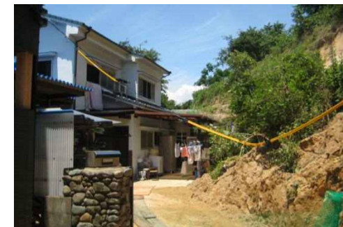
工事完了（令和2年5月8日）