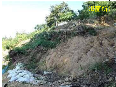
工事完了（令和2年4月24日）