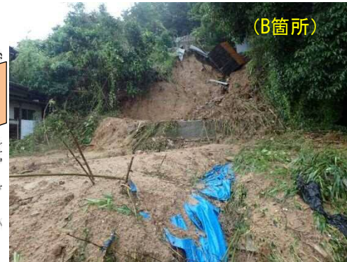
設計：パンフィックコンサルタンツ株式会社 施工：洋翔建設株式会社