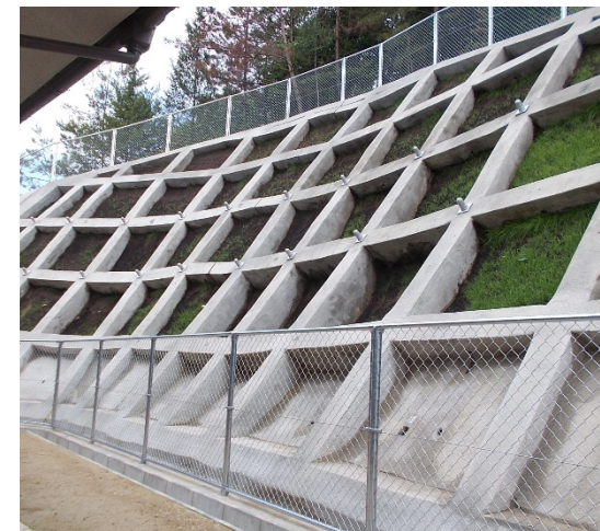
工事完了（令和2年5月25日）