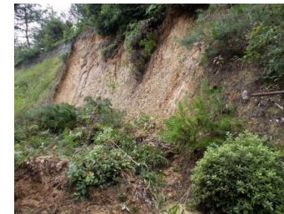
斜面崩壊・被災状況（平成30年7月）