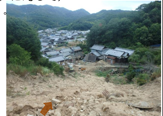
斜面崩壊・被災状況（H30年7月）