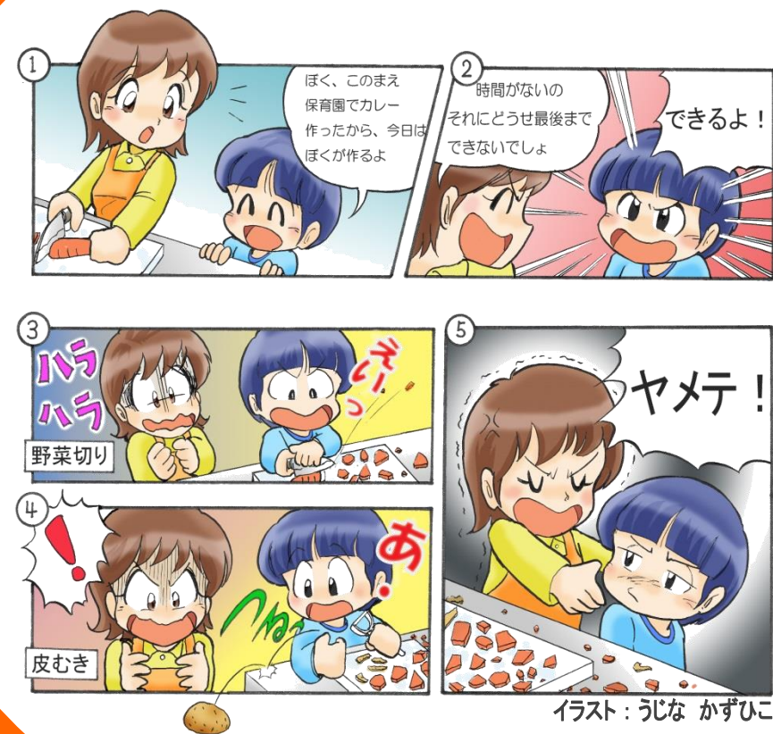
イラスト: うじな かずひこ