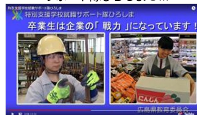
サポート隊ひろしまCM

登録企業へ就職者数は、年々増加（【表2】）しており、効果が徐々に表れているが、企業の障害者雇用への理解啓発と生徒の就職支援のため、引き続き周知を図る必要がある。