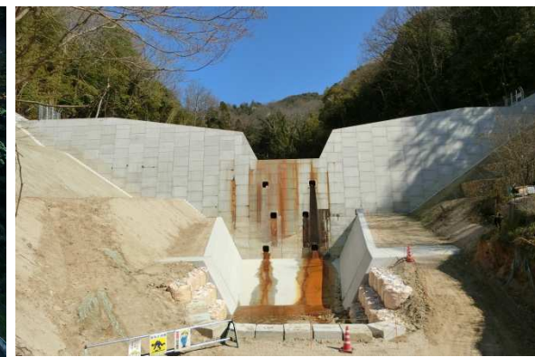
【本堤工(側壁工等)の完成状況(3月末)】