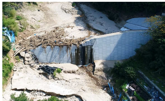
【豪雨災害直後の状況(近景)】