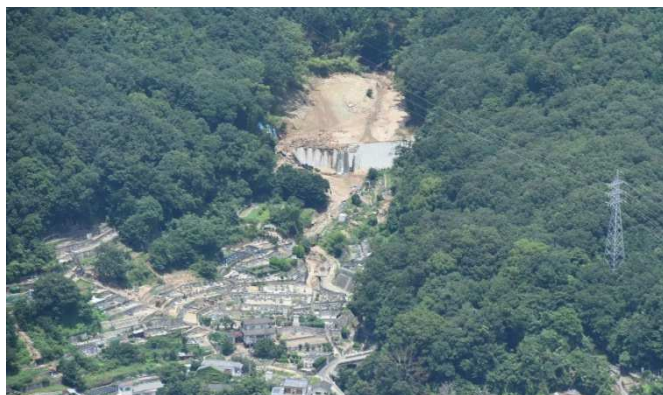
【豪雨災害直後の状況(遠景)】

なお、工事着手後の4月23日に地域住民の皆様を対象に工事説明会を開催したところ、約20名の方に参加いただきました(写真:下段左)。堰堤の整備効果や今後の工事予定等を説明し、今後も工事の実施にご理解とご協力をいただくようお願いしました。