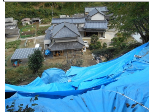
工事完了（令和2年4月17日）