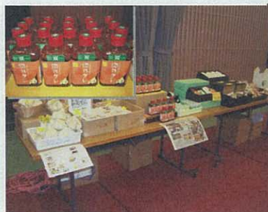
上：(株)元気丸の販売商品