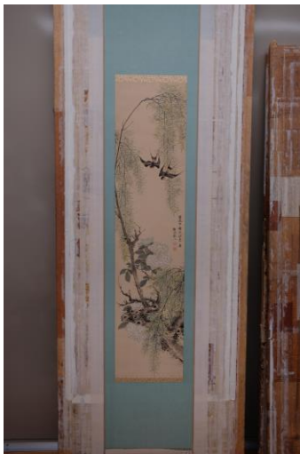
表装裂を付け廻した状態