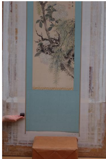
新調する軸首の検討