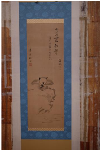
表装裂を付け廻した状態