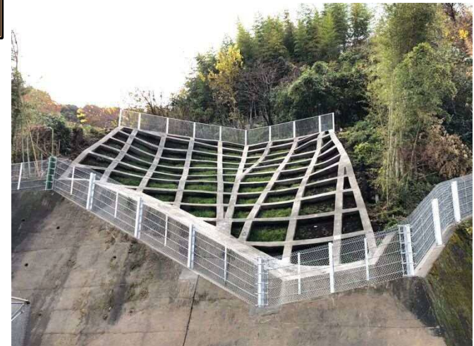
工事完了（令和元年12月25日）