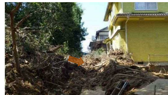
工事完了（令和元年11月22日）