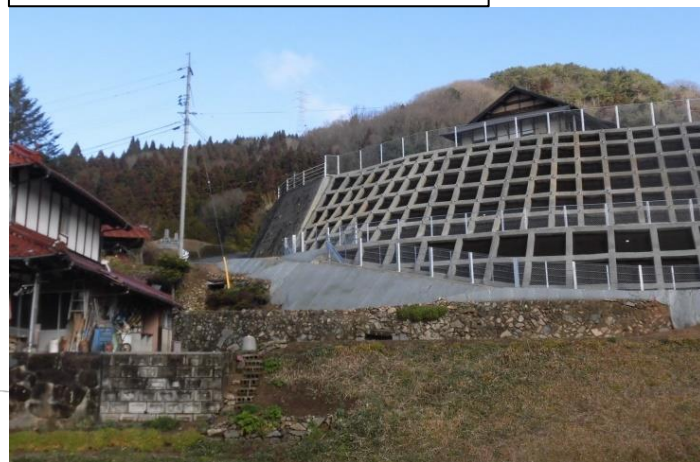
工事完了(令和2年2月28日)