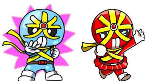
反射材活用促進キャラクター キラリ☆マンとキラリ☆ウーマン