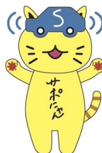
安全運転サポート車普及啓発 協議会キャラクター サポにゃん