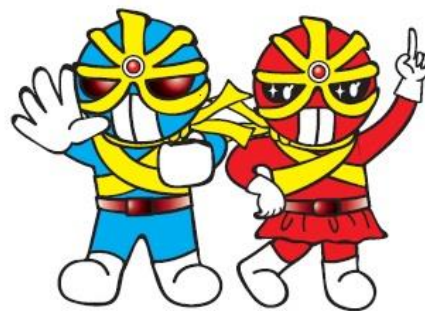
反射材活用促進キャラクター(広島県警)