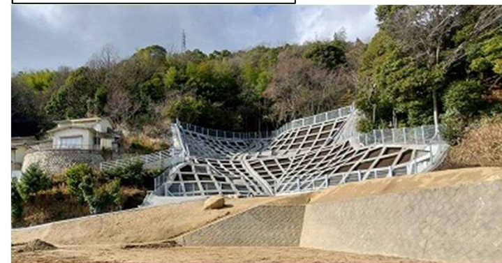
工事完了(令和2年2月13日)