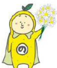
尾道市 【はっさくん】