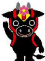
北広島町 【花田 舞太郎】