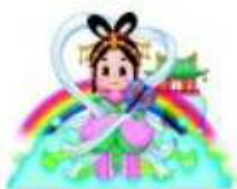
大崎上島町 【おと姫】