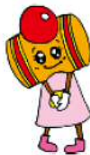
廿日市市 【たまちゃん】