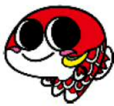
大竹市 【コイちゃん】