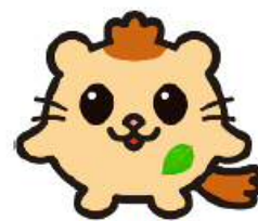
安芸太田町 【もりみん】