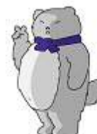
備北丘陵公園キャラクター 【きゅうくん】