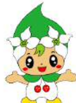
神石高原町 【ミズキちゃん】