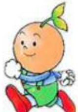
広島市 【めーでるちゃん】