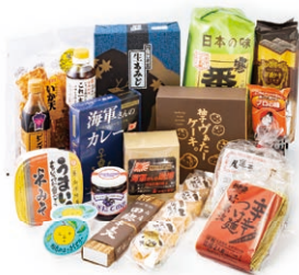
セレクトして詰め合わせ。 写真はイメージです。

各期の終了後に行う抽選で、それぞれ50名様に季節の特産品(3,000円相当)が当たります。特産品は、県内23市町から厳選した商品の詰め合わせとなりますが、期間および当選者により内容は異なります。