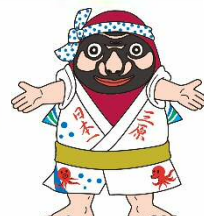
三原市 【やっさだるマン】