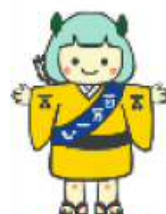
安芸高田市 【たかたん】