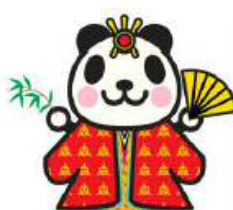
竹原市 【かぐやパンダ】