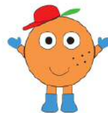
江田島市 【ミカン坊や】