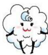
三次市 【きりこちゃん】