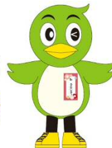
坂町 【坂 うめじろう】