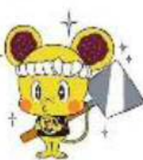
府中市 【ミンチュウ】