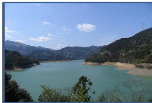
黒瀬ダムを眼下に望みます