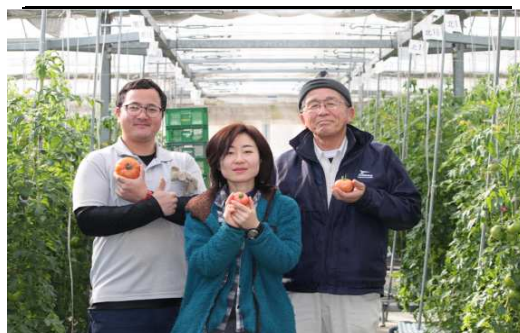
老若男女のメンバーが奮闘中