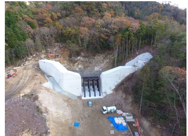
工事完了（令和元年12月3日）

設計：株式会社 荒谷建設コンサルタント 施工：(株)熊野技建 発注：西部建設事務所