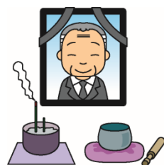
イラストは 消費者庁より

「遺品整理サービス」とは、個人が所有していた物の整理や処分等を遺族に代わって行うものです。核家族やひとり暮らしの高齢者が増加する中、注目を集めています。しかし、料金や作業内容についてトラブルになる場合もあるため、注意しましょう。