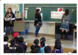
広島県手をつなぐ育成会 あび隊

13:30~ ■あいサポート運動 人権理解講座 「あび王国へようこそ」 <出演>広島県手をつなぐ育成会 あび隊