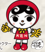
人権イメージキャラクター 人KENあゆみちゃん