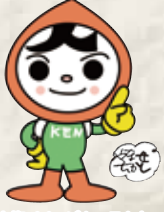
人権イメージキャラクター 人KENまもる君

「だれもがいきいきと生活できる社会」の実現をめざして 2019ひろしま 人権啓発フェスティバルを開催します!