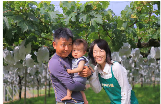
家族経営で職人気質です