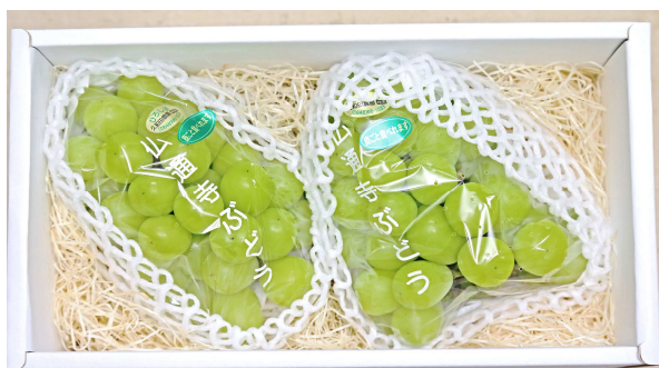
贈答用は2房入りにして販売しています