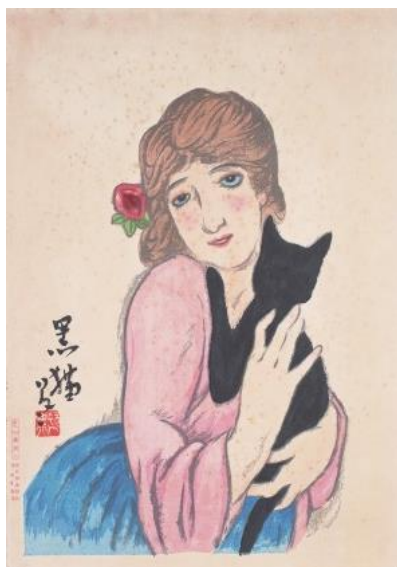
竹久夢二「女十題」黒猫 なかう 中右コレクション蔵・提供