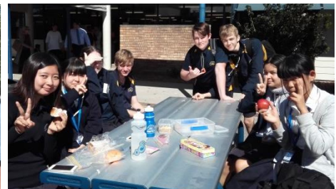
【短期留学プログラムの様子】