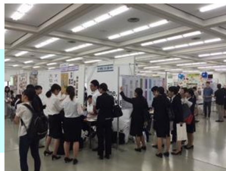
【これまでの会場の様子】