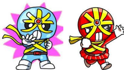
反射材活用促進キャラクター（広島県警）