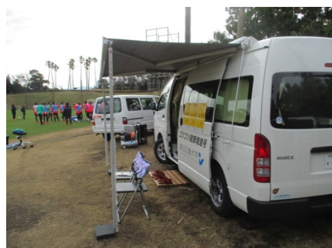
サンフレッチェ広島 鹿兒島キャンプに参加しました

○場所：エディオンスタジアム広島 お祭り広場 （広島県広島市安佐南区大塚西 5-1-1）