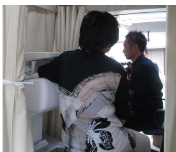
前腕の骨密度測定