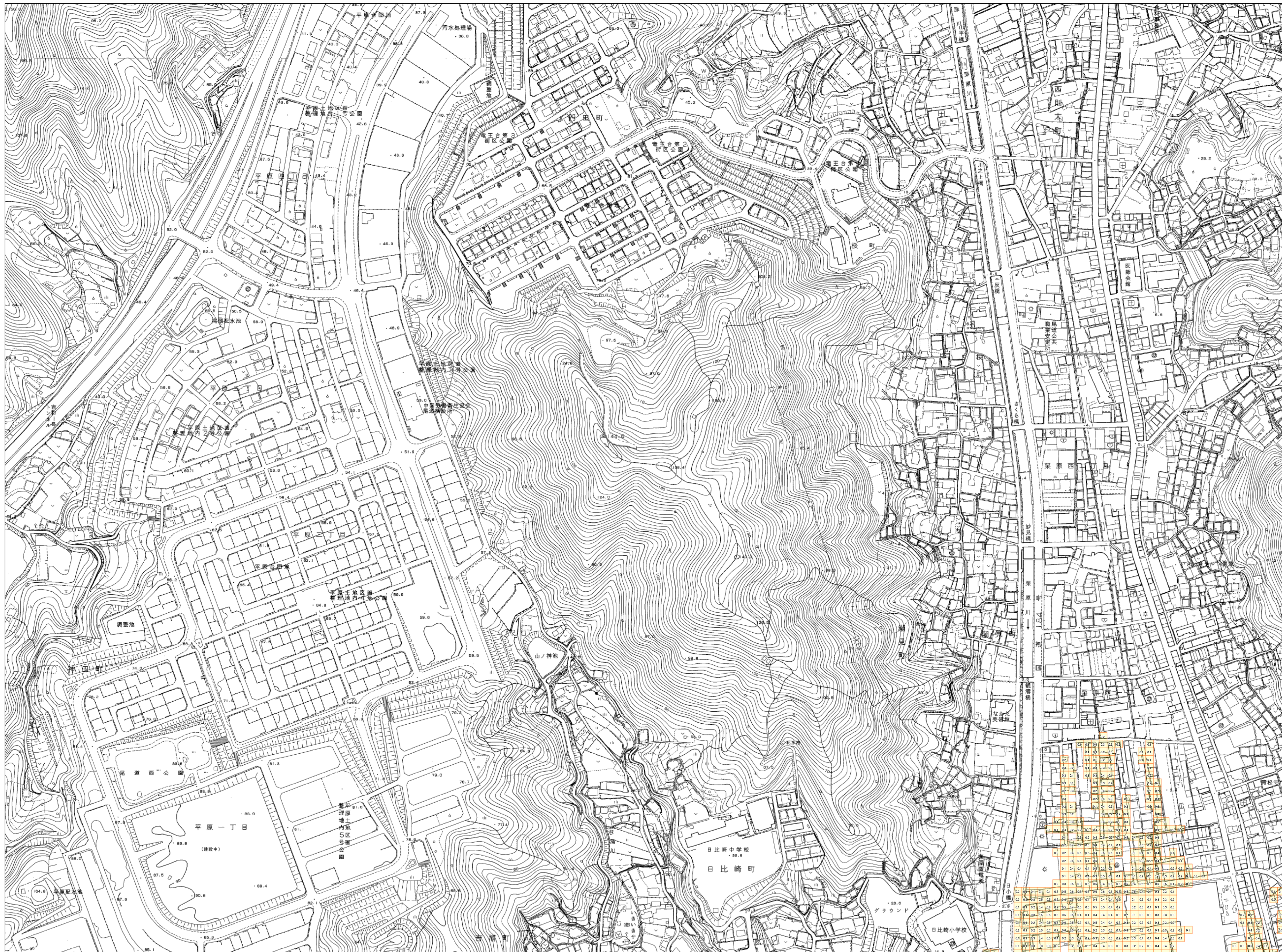
この地図は、尾道市長の承認を得て、尾道市の都市計画図（電子データ）を複製したものである。（承認番号 平28尾都第341号）