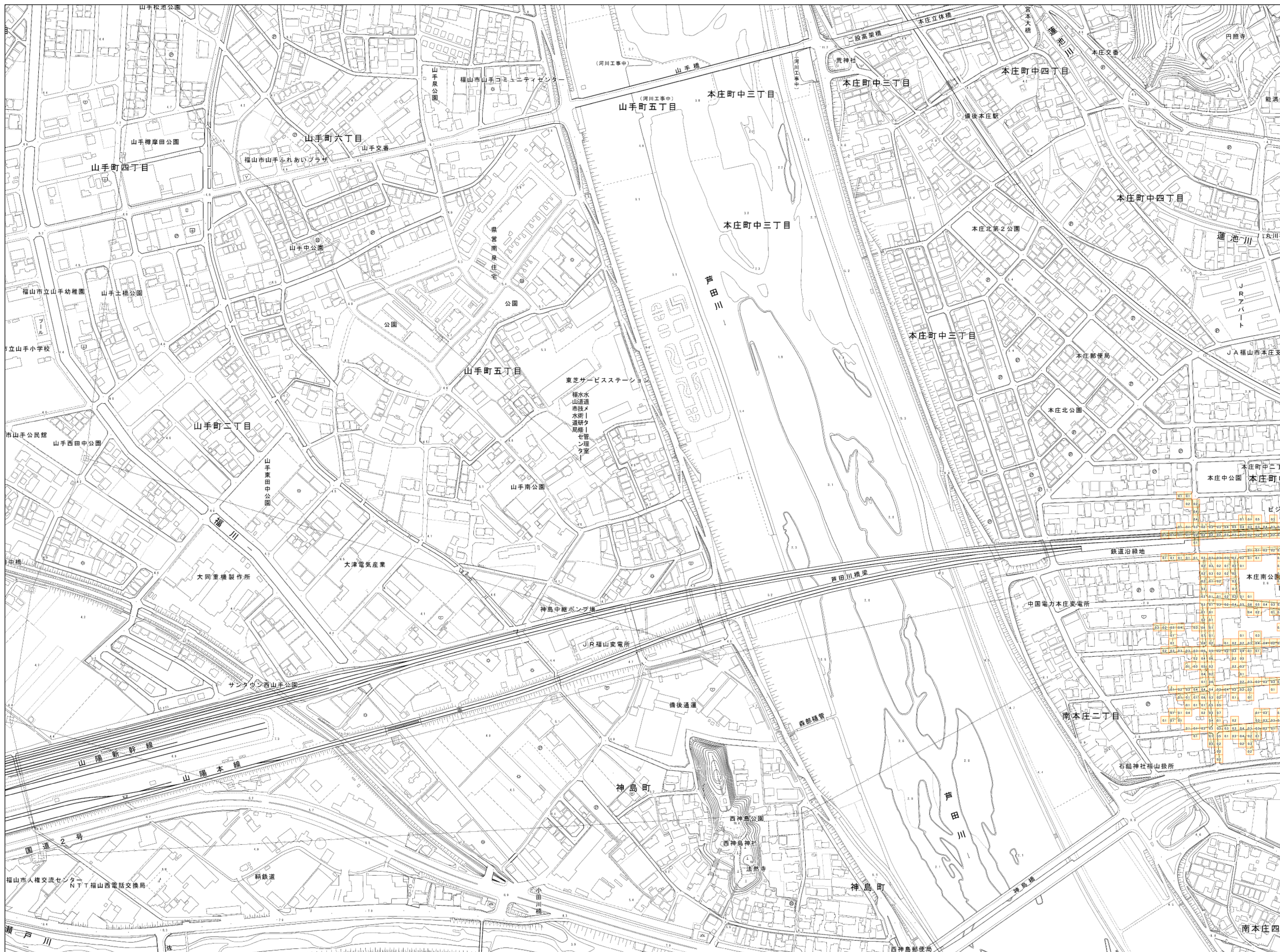
この地図は、福山市長の承認を得て、同市発行の2千5百分の1地形図を複製したものです。（承認番号 平28. 福都第333号）