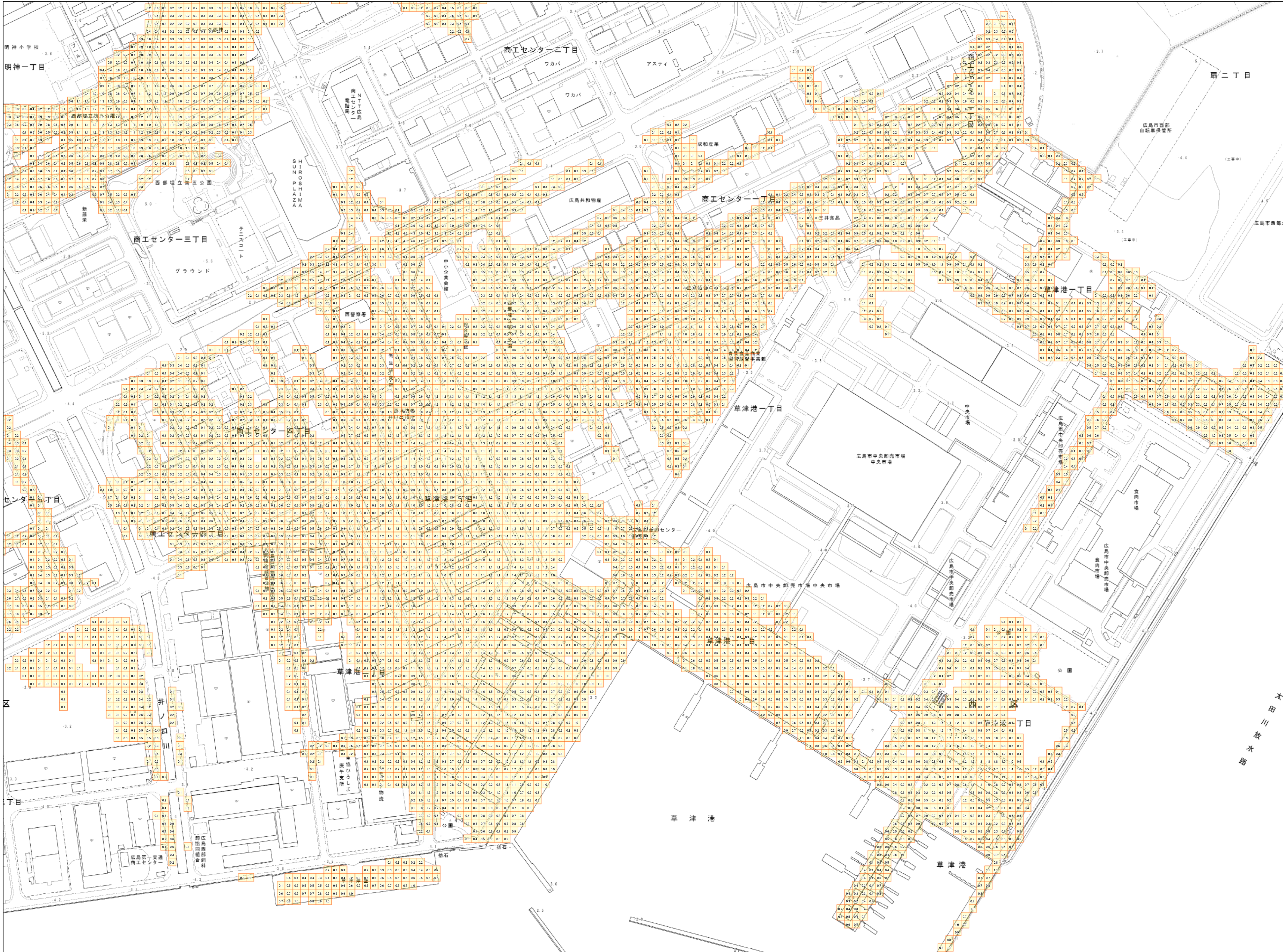
この地図は、広島市長の承認を得て、広島市発行の1/2,500地形図を複製したものである。