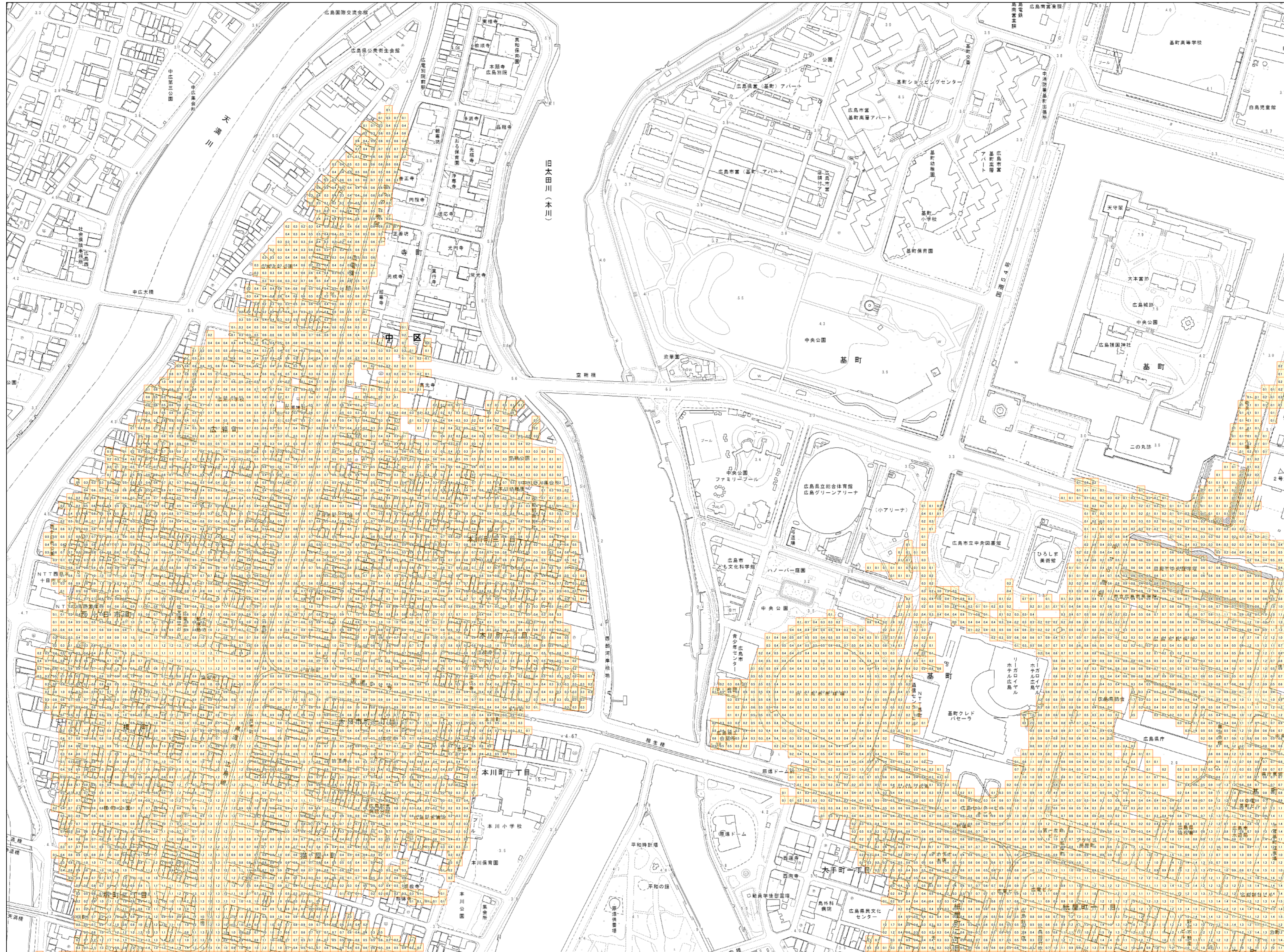
この地図は、広島市長の承認を得て、広島市発行の1/2,500地形図を複製したものである。