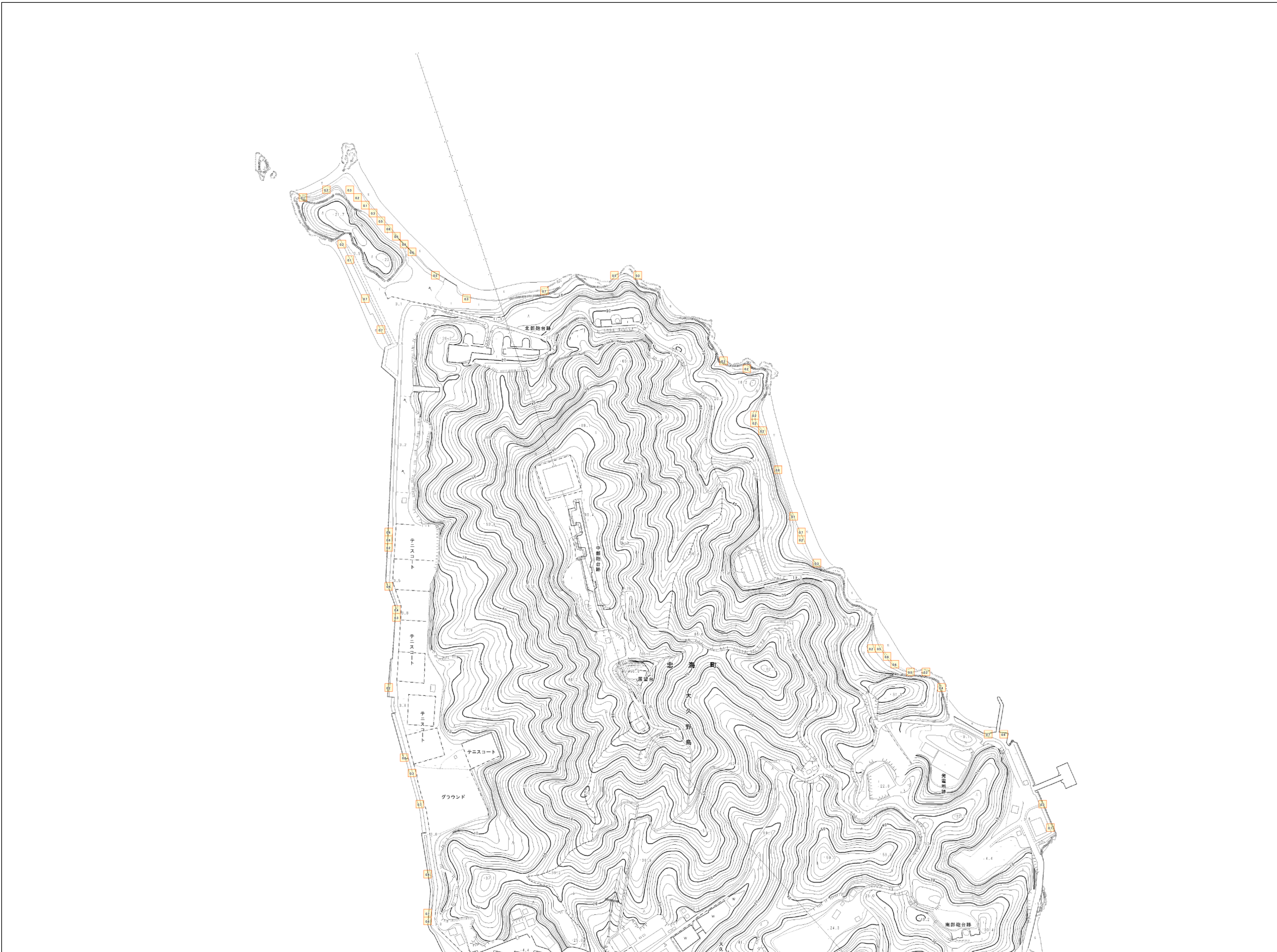
この地図は、竹原市長の承認を得て同市発行の25百分の1地形図を複製したものである。（承認番号 平成28年7月29日 竹都第125号）