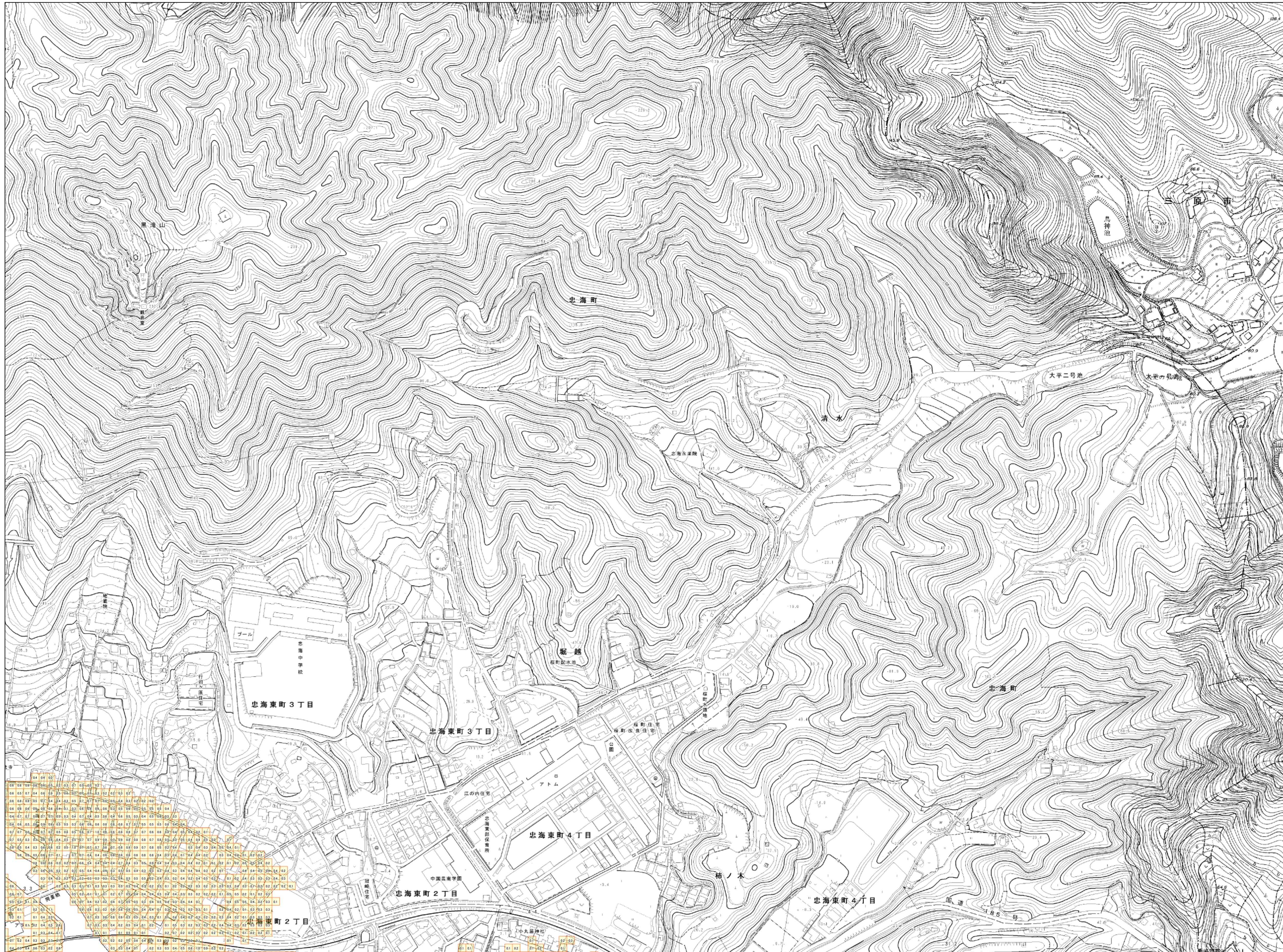
この地図は、竹原市長の承認を得て同市発行の25百分の1地形図を複製したものである。（承認番号 平成28年7月29日 竹都第125号）