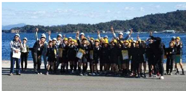
ドローンによりクラス毎で記念撮影

最後に、小学生の皆さんにとってよい思い出となるように、クラス毎にドローンにより記念写真撮影を行いました。また、見学会を通して、今後も宮島口が発展していく様子を楽しみにしていただくようお願いして、今年度の見学会を終えました。