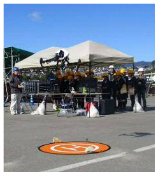
ドローンによる空撮体験（カメラ操作を体験）

現場見学では、施工業者の指導のもと、ドローンによる空撮体験、トータルステーションを使用した測量体験、バックホウの試乗体験をしてもらいました。