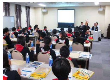
まちづくりについて感想・質問をもらう

現場見学では、施工業者の指導のもと、ドローンによる空撮体験、トータルステーションを使用した測量体験、バックホウの試乗体験をしてもらいました。