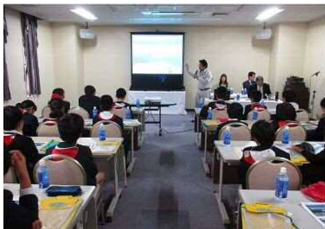
宮島口の整備に関心を深める生徒達