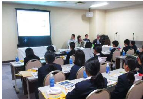
県・市より宮島口の歴史や事業概要を説明

広島県土木建築局建設産業課より建設業の役割について説明があり、建設業への理解と興味・関心を深めていただきました。