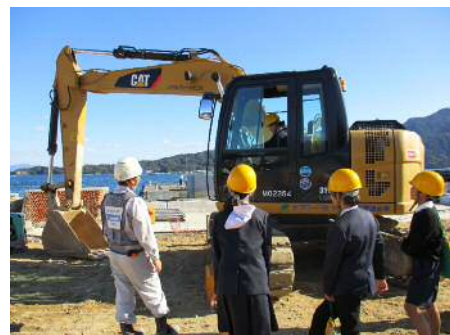
バックホウの試乗体験

最後に、小学生の皆さんにとってよい思い出となるように、クラス毎にドローンにより記念写真撮影を行いました。また、見学会を通して、今後も宮島口が発展していく様子を楽しみにしていただくようお願いして、今年度の見学会を終えました。