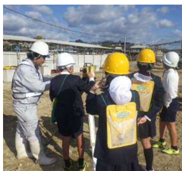
トータルステーションの操作体験