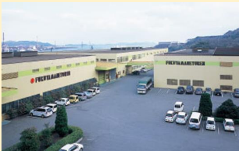
福山テクノ工場 外観

航空機部品に関しては、広島工場において、(株)IHI殿より認定をいただいた真空炉で、エンジン部品の溶体化処理、安定化処理、時効処理などを行っています。