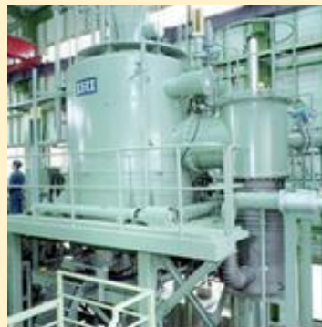
広島工場 大型真空炉