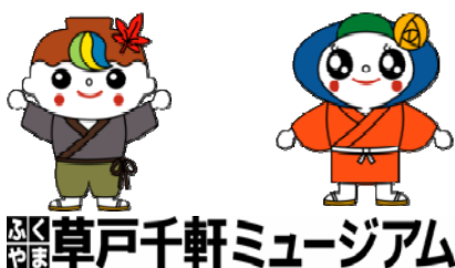
県立歴史博物館のマスコットキャラクター 「くさどっきー」(左)と「せんちゃん」(右)です。

ふくやま文化ゾーン：福山駅の北側に広がる、文化施設や歴史的な建物が集中するエリア 文化ゾーン内文化施設：福山城博物館・ふくやま美術館・ふくやま書道美術館・ふくやま文学館 福山市人権平和資料館・ふくやま草戸千軒ミュージアム