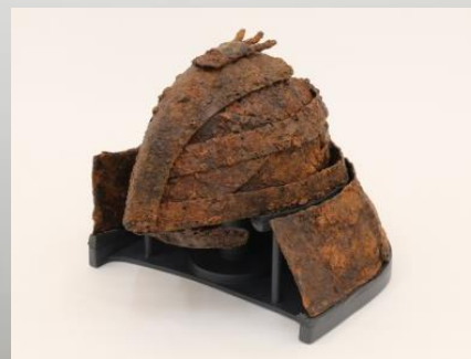
重要文化財 茶すり山古墳出土衝角付冑

広島県立図書館では、広島県立歴史民俗資料館と連携して、この企画展について写真パネルで紹介するとともに、展示内容に関連する図書館資料の展示・貸出しを行います。