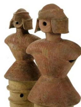
重要文化財 長瀬高浜遺跡出土甲冑形埴輪