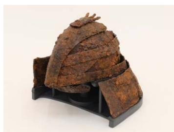
重要文化財 茶すり山古墳出土衝角付冑