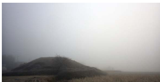
背景：霧の糸井大塚古墳（三次市）

県立図書館では、みよし風土記の丘ミュージアムと連携して、秋の特別企画展について写真パネルで紹介するとともに、展示内容に関連する図書館資料の展示・貸出しを行います。