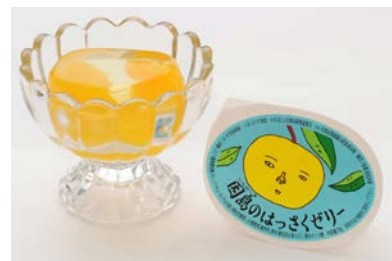
因島のはっさくゼリー