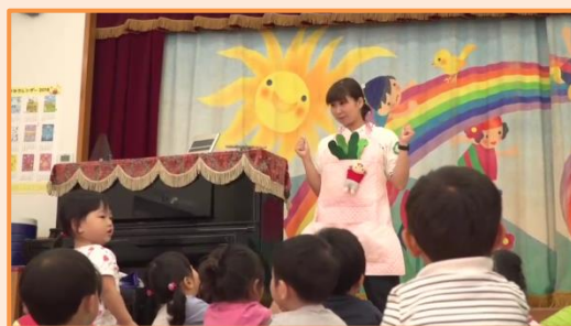
サイト内の動画の一幕 「エプロンシアター(若竹保育園)」