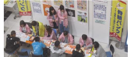
(過去の登録会の様子)