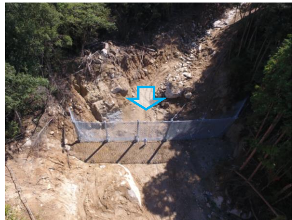
ワイヤーネット設置状況（上空より）