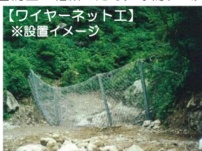
【ワイヤーネット工】 ※設置イメージ

リング状の鋼材をつなぎ合わせたネットを安定した地中の岩盤と連結し、引張力によって固定（アンカー工法）しています。土石流が発生する溪流の出口付近に設置し、土砂を捕捉します。二次災害防止・軽減のため、砂防ダム完成までの応急対策として施工します。