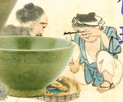
青磁碗 (重要文化財 広島県 草戸千軒町遺跡出土品) (当館蔵)

国の重要文化財の「広島県草戸千軒町遺跡出土品」や「菅茶山関係資料」など、保存修理を行った文化財の展示をとおして、保存修理の意義を紹介します。