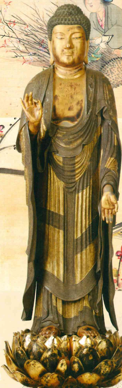
広島県重要文化財 木造阿彌陀如来立像 (常称寺蔵)