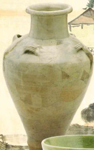
白磁四耳壺 (重要文化財 広島県 草戸千軒町遺跡出土品) (当館蔵)