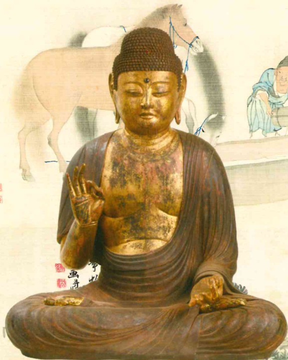
広島県重要文化財 木造阿彌陀如来坐像 (当館蔵)