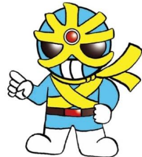
反射材活用促進キャラクター キラリ☆マン