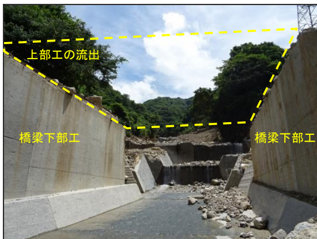
【写真①】被災状況 [H30. 7. 13 撮影]

橋梁名：上段原橋 (かみだんばらはし) 橋長：L=11.0m 幅員：W=10.8m (2車線+歩道)