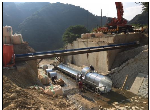
【写真②】復旧状況 [H30. 8. 6 撮影]