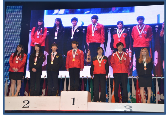
洋菓子製造職種：金賞・銀賞・銅賞