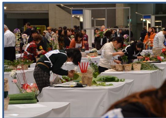
フラワー装飾職種