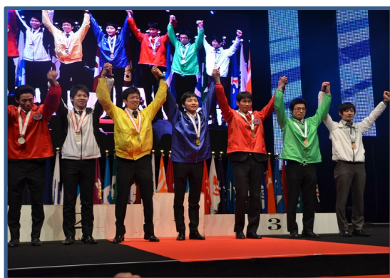
電気職種：銀賞・銅賞