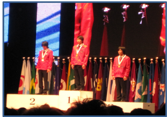
曲げ板金職種：表彰台独占