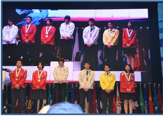
西洋料理職種：銀賞(2)・銅賞