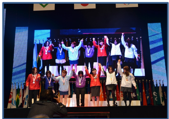
和裁職種：銀賞・銅賞