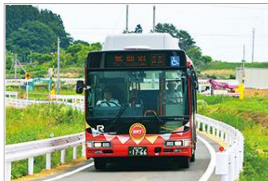
東日本大震災後の気仙沼線・大船渡線BRTの運行の様子

災害時BRTとは、災害により一般車両が通行止めとなった高速道路・自動車専用道路を路線バス等指定されたバスを通行可能とし、混雑した他の道路の通行を回避することにより速達性や定時制を確保する方法