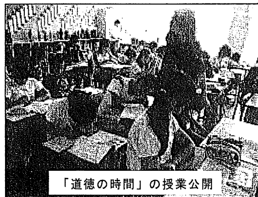
「道徳の時間」の授業公開