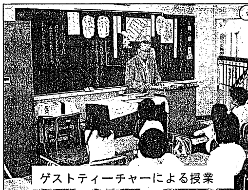
ゲストティーチャーによる授業

府中町では全ての学校で保護者に「道徳の時間」の授業公開を行っています。また、多くの学校では、地域の方にゲストティーチャーとして授業の参加・協力を得たり、保護者対象の模擬授業、保護者と作る道徳の劇づくり、授業後の懇談会等を行ったりして、地域や保護者の方と連携した道徳教育を推進しています。