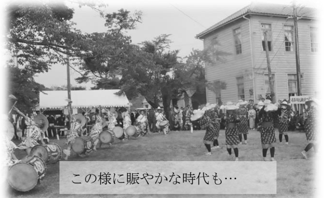
この様に賑やかな時代も…

近年は外観で建物の老朽化が分かるようになり，内部も雨漏りによって建物自体危険な状態です。