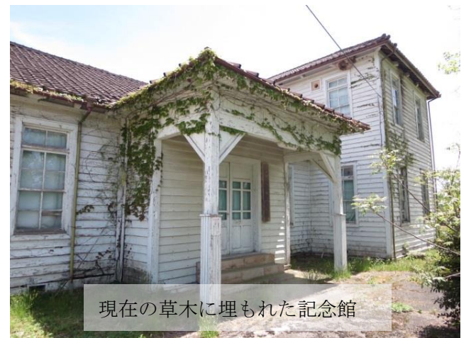
現在の草木に埋もれた記念館

今回，紙面をお借りして記念館の現状を知っていただき，将来の利活用方法を含め，広く皆様方のお知恵をお借りして，より良い対応をとりたいと考えております。