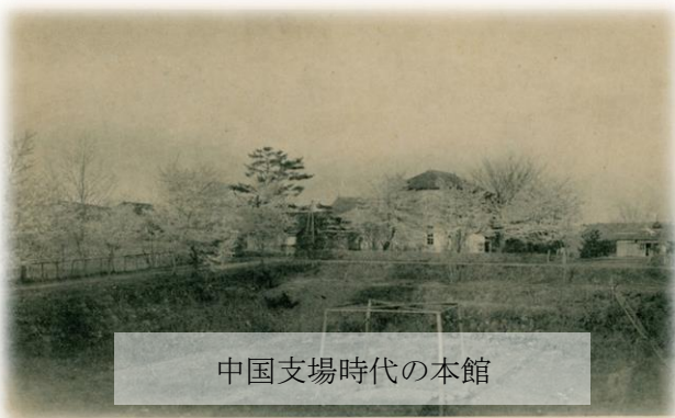
中国支場時代の本館

広島県の県北、庄原市七塚町にある畜産技術センターは、今から 100 年以上昔の 1900 年に国営（農総務省）の種牛牧場として設立されました，現在の県立として移管されたのは大正 12 年で，たいへん長い歴史を有している施設です。