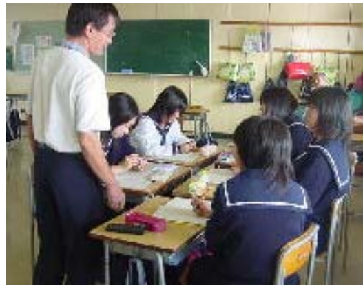
グループ学習を行う生徒（10月1日）