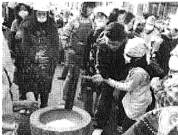
伝統行事の餅つき大会

保護者や地域の方とのふれあい交流、地域清掃やボランティアなどの実践活動を学校・家庭・地域が一体となって行い、児童生徒の道徳性育成に努める。