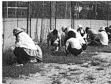
保護者と生徒による環境整備